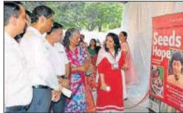
■ The exhibition 'Seeds of Hope' organised at La Martinere Girls' School here on Tuesday.