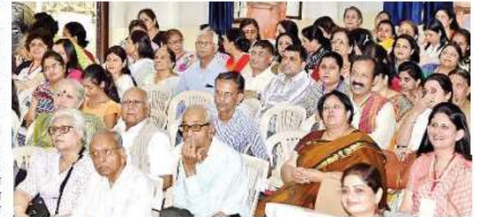
सेमिनार में शामिल लोग

प्रदर्शनी से हर किसी को मिली ऊर्जा : प्रदर्शनी में जल संरक्षण की दिशा में वनस्थान के जोहाडू गांव में सराहनीय प्रयास करने वाले राजेंद्र सिंह को नजीर के रूप में दर्शाया गया। राजेंद्र को दूध