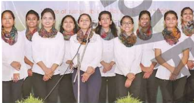
सेमिनार में विभिन्न सांस्कृतिक कार्यक्रम हुए, छात्राओं ने समूह गायन प्रस्तुत कर सभी बांध दिया