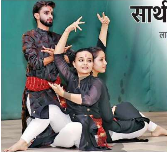
आशाओं के बीज विषय पर हुए सेमिनार के शुभारंभ पर नृत्य प्रस्तुत करते कलाकार • जागरण

लामार्टीनियर गर्ल्स कॉलेज में 'सीड्स ऑफ होप' पर प्रदर्शनी का आयोजन, जीत हासिल करने की मिली प्रेरणा