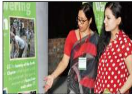
GO GREEN: Visitors at the exhibition at La Martiniere Girl's College

Titled 'Seeds of Hope', the exhibition propagates the idea of 'It starts with one'. "We want visitors to know that great changes can be made by even an individual and we want to make children