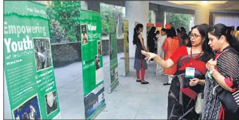
लॉ-मार्टिनियर गर्ल्स कॉलेज में प्रदर्शनी 'सीड्स ऑफ होप' का उद्घाटन किया गया

करेगी के एक सकारात्मक बदलाव लाने के लिए एक ही व्यक्ति काफी है जैसा कि सोका गव्काई इंटरनेशनल के अध्यक्ष दाइसकु इकेदा कहते हैं श एक व्यक्ति समाज और दुनिया में चिरस्थायी बदलाव ला सकता है शू ए इस प्रदर्शनी का उद्देश्य हर उस व्यक्ति के हृदय में उम्मीदों का बीज बोना है जो पर्यावरण एवं समाज में एकेले ही बदलाव लाने का साहस रखते हैं। हम चाहते हैं हर दर्शक समाज और इस देश को बेहतर से बेहतर बनाने का दृढ़ निश्चय ले और उम्मीद की लहर के साथ वापस लौटें।