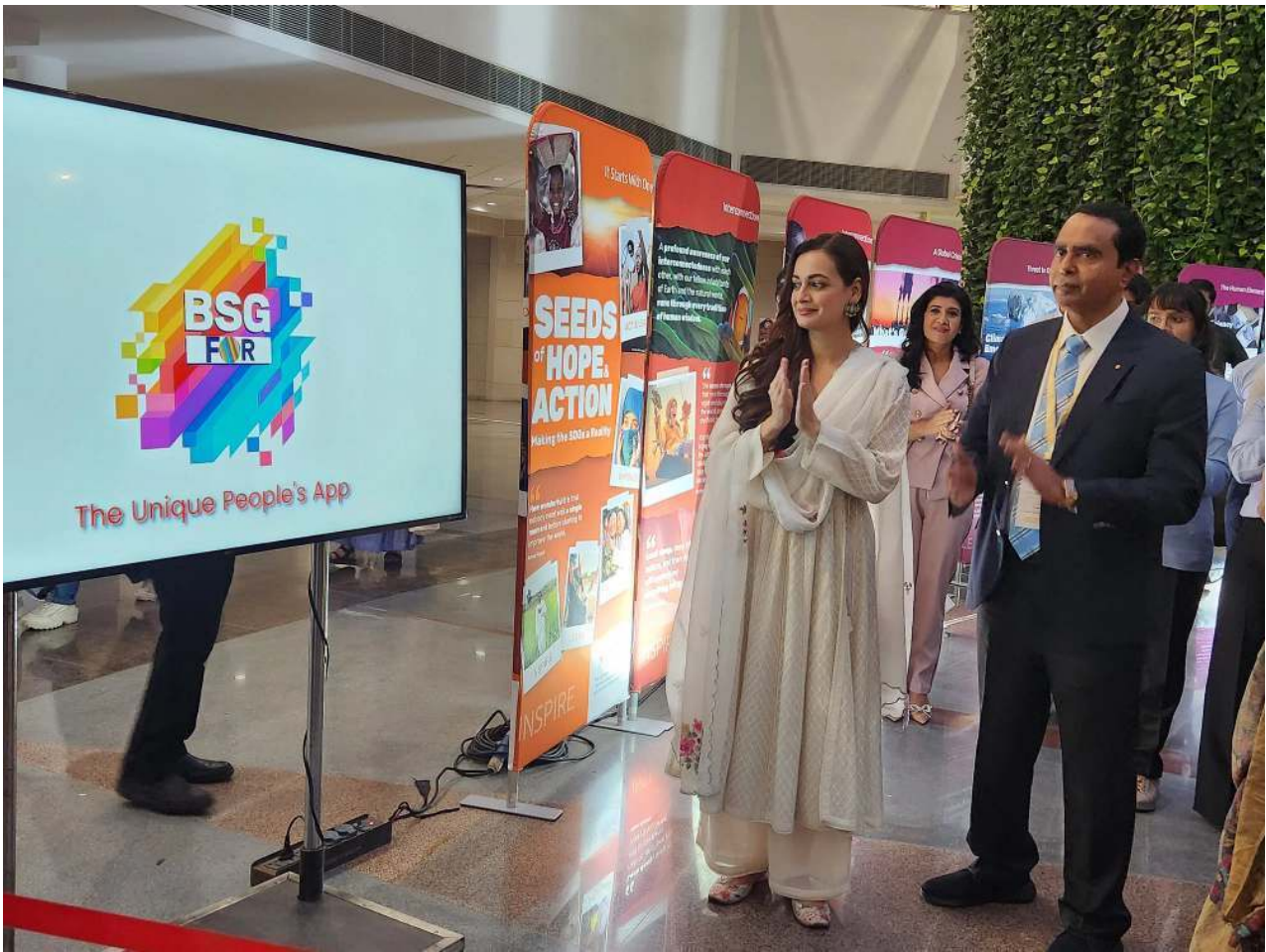
Dia Mirza, actor, and a UN Environment Goodwill Ambassador at Bharat Soka Gakkai Peace and Sustainability Conclave |

New Delhi: As the world moves towards a post-pandemic era, Bharat Soka Gakkai, the Indian arm of Soka Gakkai International, organized a peace and sustainability conclave to discover a path to revive humanity.