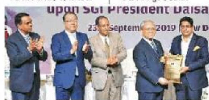
नई दिल्ली में डॉ. अंबेडकर इंटरनेशनल सेंटर में सोका के अध्यक्ष डॉ. दाइसाकु इकेदा को डॉक्टरेट की मानद उपाधि से सम्मानित किया गया • जागरण

• 390 के करीब डॉक्टरेट की मानद उपाधि कर चुके हैं हासिल