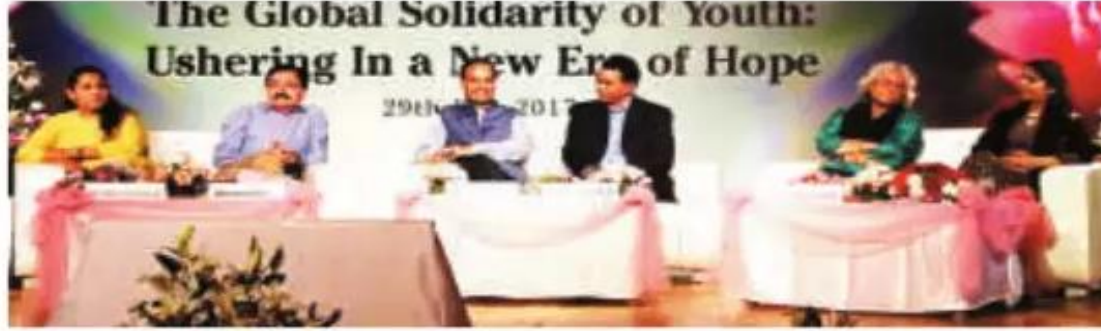
शांति संवाद कार्यक्रम में उपस्थित अतिथि।